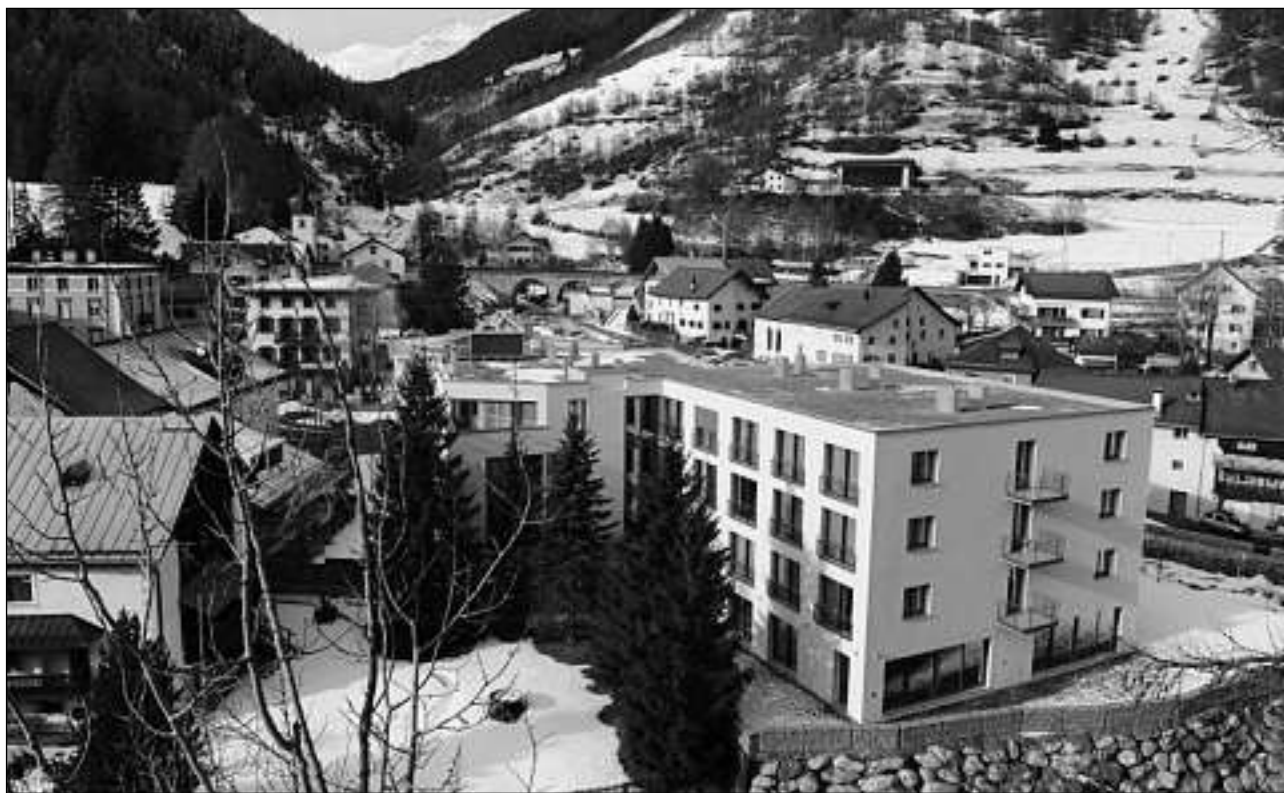
Uossa po la Clinica Holistica a Susch eir tour sü paziaints chi sun sgürats in möd fundamental pro sgüranzas grischunas.

Dals 46 lets chi stan a disposiziun a paziaints chi han la malatia da «burnout» sun tschinch da quels reservats per paziaints chi sun sgürats pro las chaschas d'amalats grischunas in möd fundamental. «Insomma», precischa Bulfoni, «que sun lets per paziaints chi nu sun sgürats in möd privat o per da