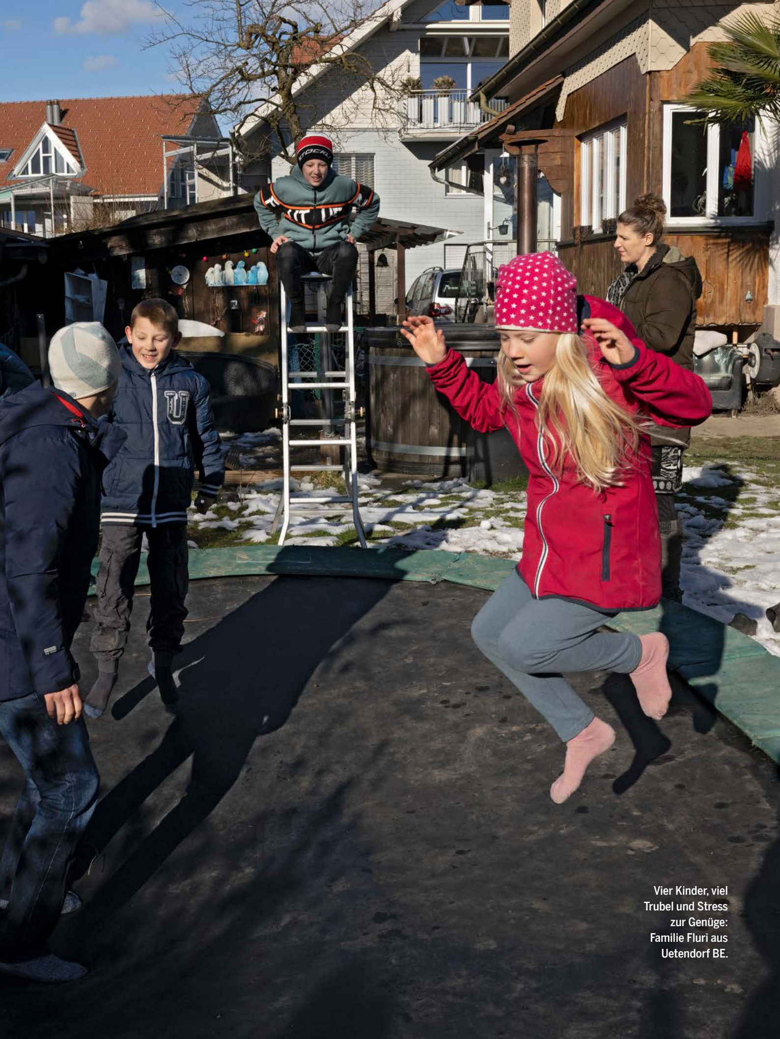
Vier Kinder, viel Trubel und Stress zur Genüge: Familie Fluri aus Uetendorf BE.